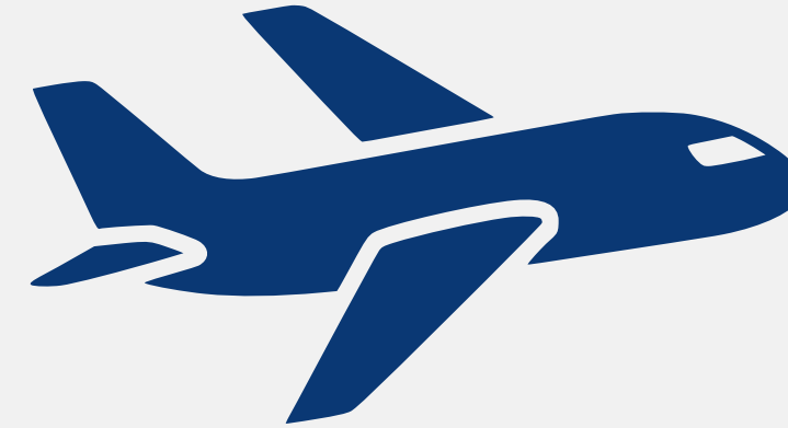
邀請買主採購洽談