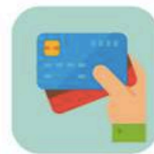
信用卡 / 現金卡